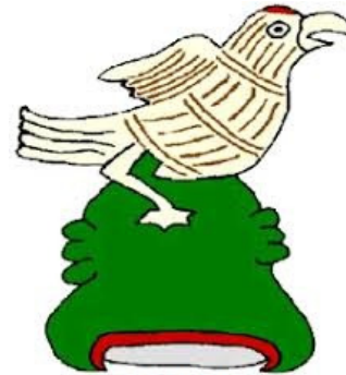
Municipio San Bartolo Tutotepec