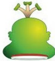
PRESIDENCIA MUNICIPAL CUAUTEPEC DE HINOJOSA, HGO.